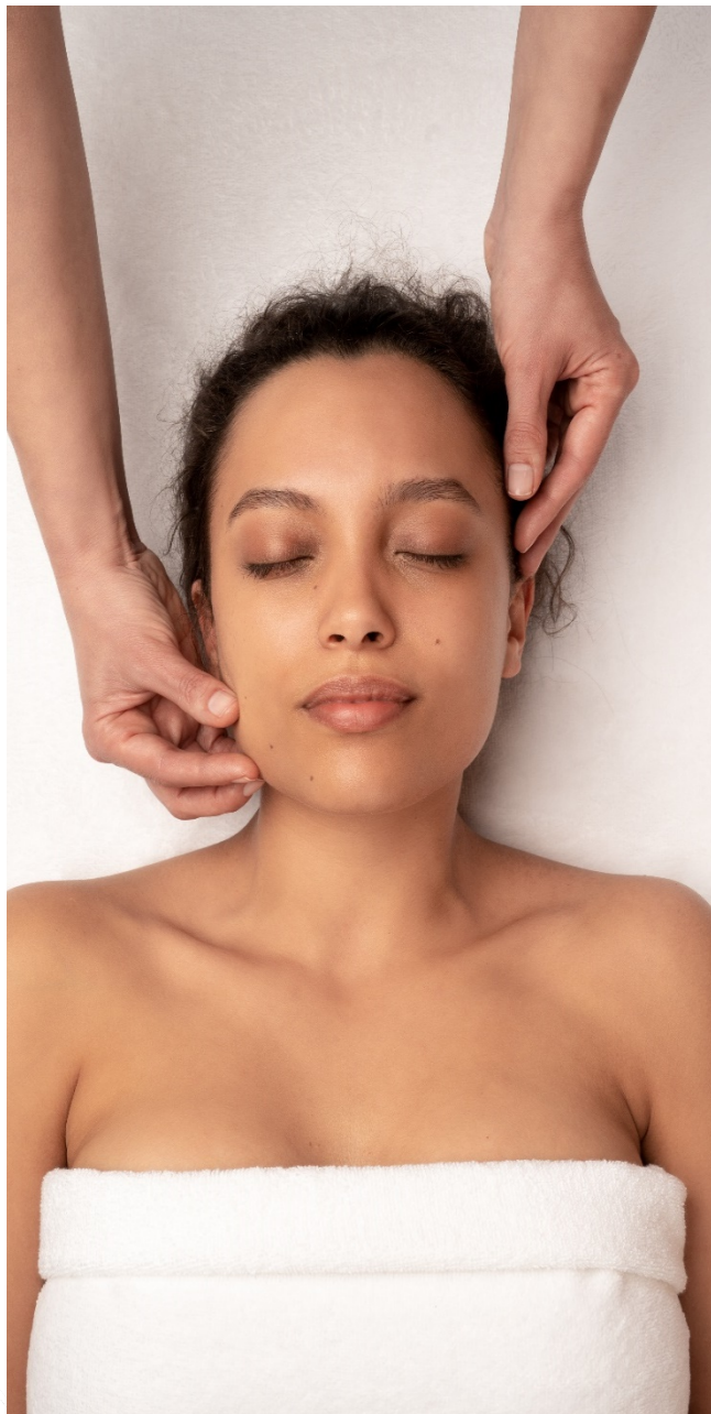
Soins Massages du Visage